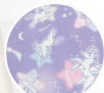
ユニコーン星空柄