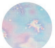
ミルキーウェイ柄